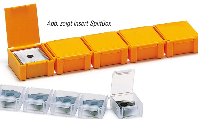
Abb. zeigt Insert-SplitBox