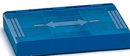
Abb. zeigt InsertBox

Rupolzer Straße 53 D-88138 Hergensweiler/Lindau Tel. ++49/83 88/92 00-0 Fax ++49/83 88/10 24 info@rose-plastic.de www.rose-plastic.de